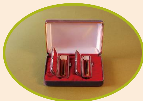
※白の見返しに「卒業記念」等の文字が入ります。 詳細は裏面をご覧ください。

(見本の印影はすべて左側が「徳川家康」、右側が「徳川」です。大きさは実際の印影とは異なります。)