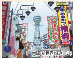
大阪・新世界(イメージ)