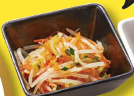
彩り野菜のナムル