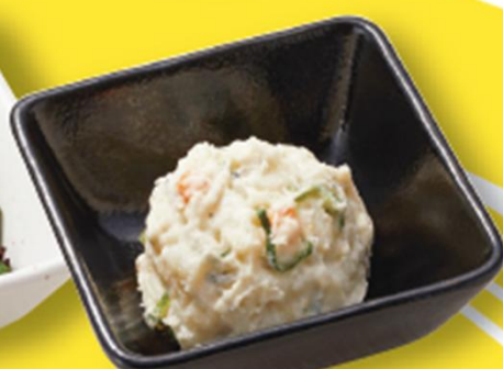
山海和風ポテトサラダ