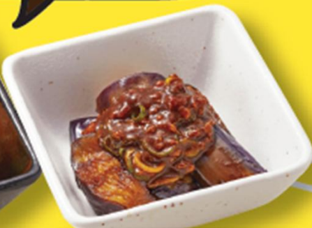
ナスと肉味噌の小鉢