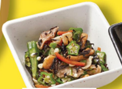
オクラと豚肉の 梅ひじき和え