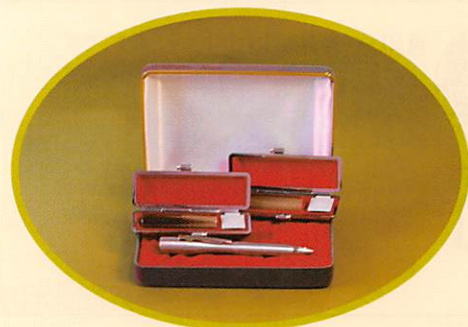
※白の見返しに「卒業記念」等の文字が入ります。詳細は裏面をご覧ください。

(見本の印影はすべて左側が「徳川家康」、右側が「徳川」です。大きさは実際の印影とは異なります。)